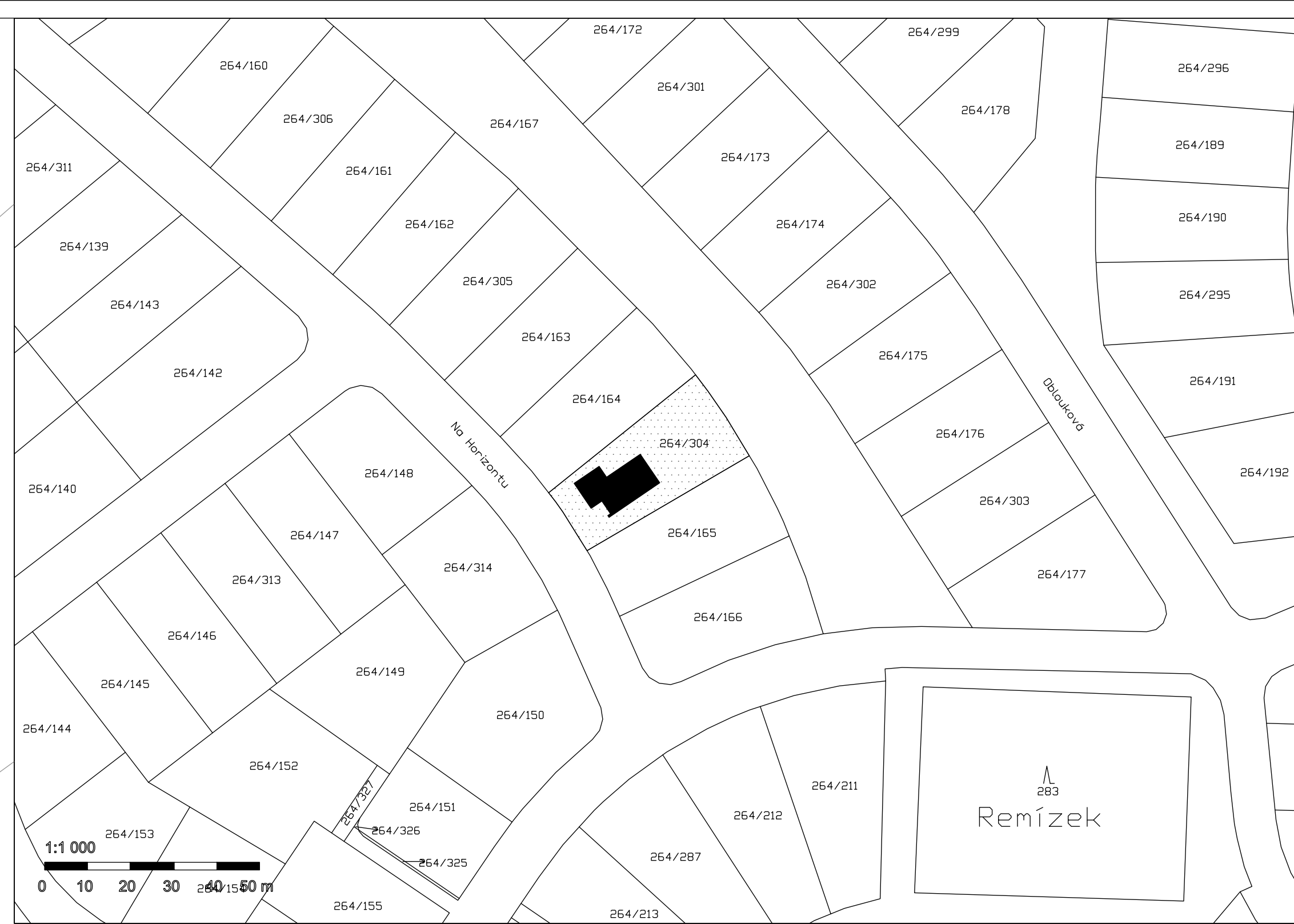
KATASTRÁLNÍ SITUÁČNÍ VÝKRES 1:1000